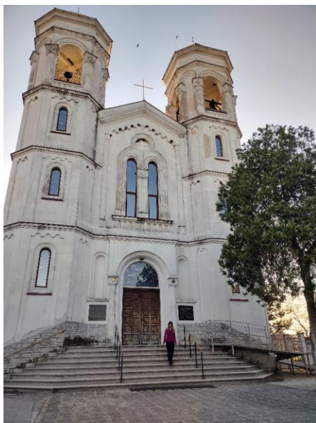
Фиг. 8. Църквата в село Белозем