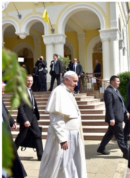
Фиг. 1. Негово Светейшество понтифексът на Римокатолическата църква папа Франциск пред храма в град Раковски, 6 май 2019 г., снимка – авторите