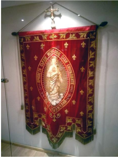
Фиг. 11. Хоругва