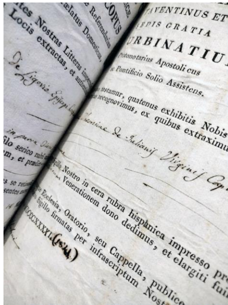
Фиг. 6. Новооткрито свидетелство за предоставени реликви на храма в село Белозем „Св. Франциск от Асизи“