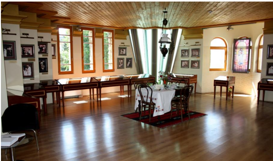
Фиг. 13. Интериор от къщата на майка Тереза, Скопие, снимка – авторите