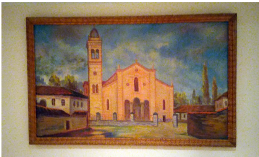
Фиг. 2. Художествена творба с изобразена втората постройка на църквата „Пресвето сърце Исусово“