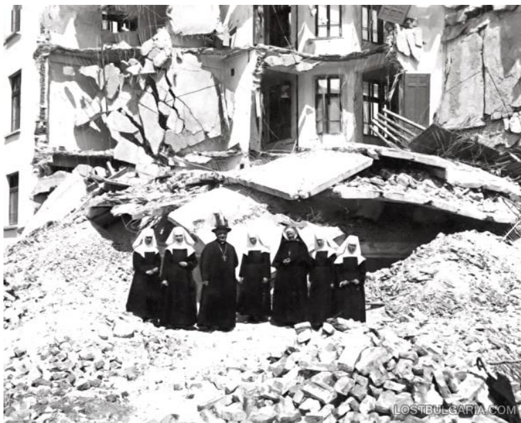
Фиг. 7. Монсеньор Ронкали пред руини от Чирпанското земетресение