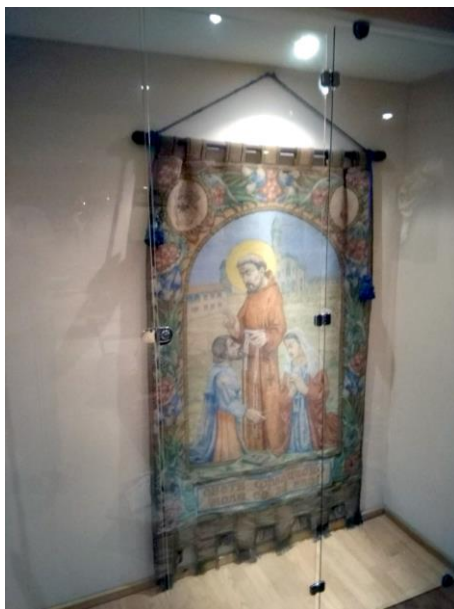
Фиг. 10. Хоругва