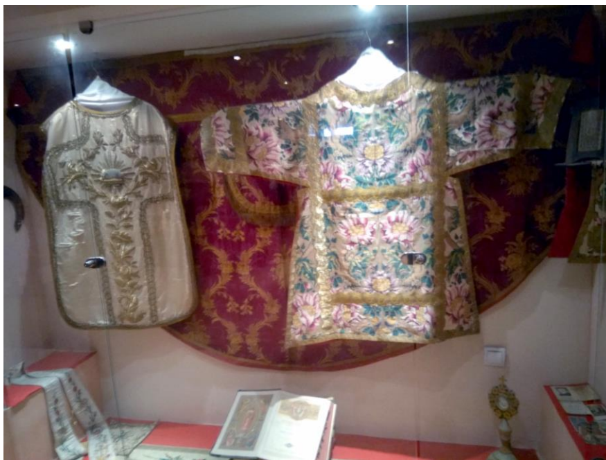
Фиг. 3. Църковни одежди за богослуженията