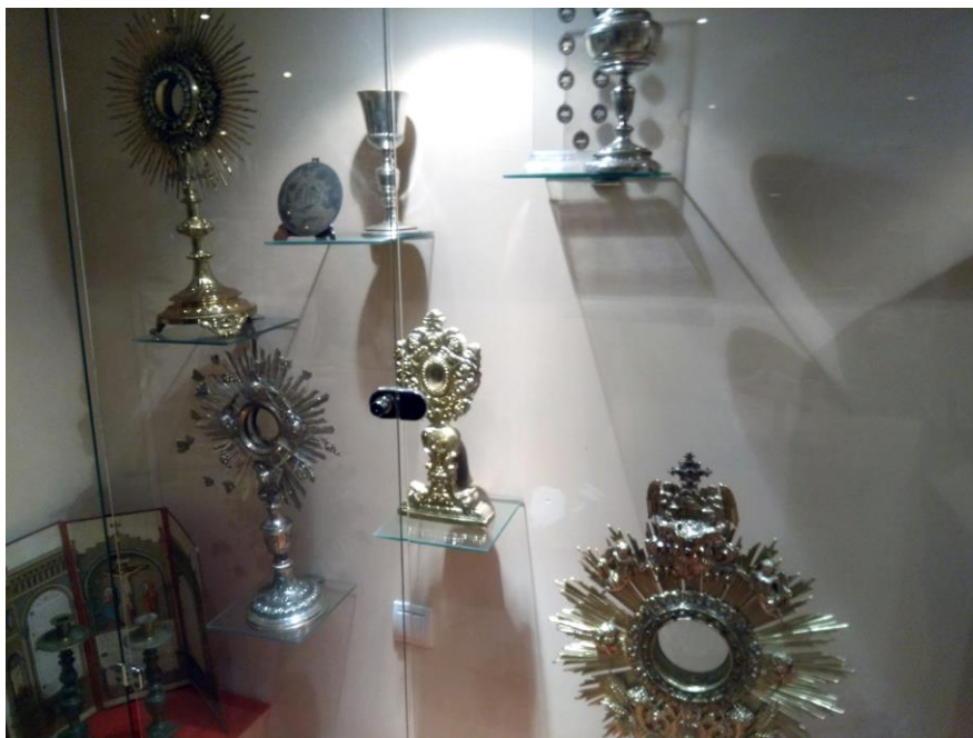
Фиг. 9. Монстранциите в криптата