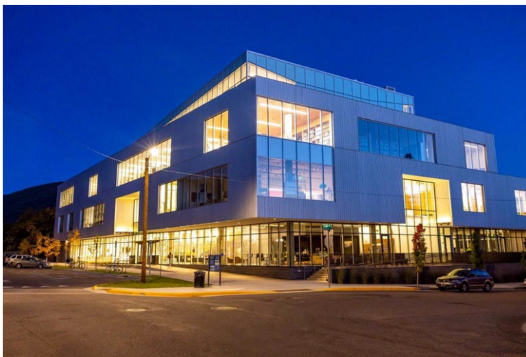
Фиг. 7. Сградата на библиотеката в Мисула е домакин на различни събития.

Проектът „1001 libraries to see before you die“ („1001 библиотеки, които трябва да видиш, преди да умреш“) е друга инициатива на IFLA, насочваща вниманието на обществеността към туристическия потенциал на библиотеките. Той е предназначен за всеки, който планира пътуване и има желание да посети библиотека там, където отива. Проектът е реализиран от екип от Секцията за обществени библиотеки на IFLA, който си поставя за цел да събере на едно място примери за най-добри библиотечни пространства от цял свят. Концепцията е дело на Анет Мьоберг, член на Постоянния комитет на Секцията за обществени библиотеки на IFLA, а инициативата е стартирана съвместно със Секцията „Библиотечни сгради и оборудване“ на IFLA. 11 Принципът на обогатяване с ресурси на интернет платформата на проекта е чрез номинации на библиотеки от цял свят, предложени на екипа на Секцията за обществени библиотеки. Изборът може да е заради сградата на библиотеката, местоположението ѝ, иновативните програми, които реализира, или ангажираността на общността. Освен това порталът включва връзки към други уебсайтове и информация по темата. 12