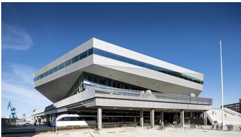
Фиг. 3. Изграждането на „Dokk1“ отнема 4 години.

Библиотеката предоставя безплатен достъп до свят на информация, вдъхновение, обучение и забавление. Определят я като „Дома на гражданите“, а персоналът и ръководството ѝ непрекъснато работят с участието на местната общност. „Dokk1“ е с фонд от около 350 000 хартиени, аудио- и електронни книги, списания, музика и игри на CD и DVD, като въпреки големия им брой логичната и ясна структура улеснява намирането на това, от което се нуждаят потребителите. 6