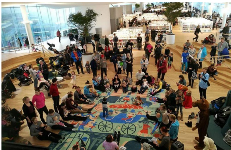
Фиг. 5. Всеки посетител на „Ооди“ има възможността да участва в различни събития.

През 2021 г. наградата е присъдена на „Дайхман Бьорвика“ – централната библиотека на норвежката столица Осло (вж. фиг. 6). Всеки от шестте ѝ етажа има различна атмосфера и функции и предлага по нещо за всеки – от зала за филмови прожекции до аудитория за 200 души; от пространства за занимания на най-малките до такива, в които се организират литературни събития; от своеобразна вселена от музика, филми, комикси, игри и приказки до работилници за заемане и използване на място на 3D принтери, шевни машини, резачки за винил, машини за печат върху текстил, широкоформатни принтери и поялници; от места за уединение до такива за провеждане на групови обучения и колоквиуми. „Дайхман Бьорвика“ разполага с колекция от почти един милион библиотечни единици, а също така там има достъп до електронни и аудиокниги чрез приложенията Allbok (на норвежки), Libby (на английски) и World Library (на няколко езика). Там се намира и т.нар. „Библиотека на бъдещето“ – арт проект с планирана продължителност от близо един век, който събира по един ръкопис годишно. Ръкописите се съхраняват непрочетени и недостъпни в библиотеката и едва през 2114 г. ще бъдат отпечатани и издадени. 9