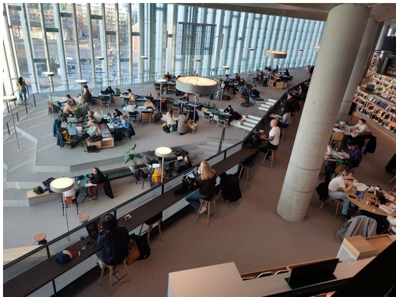
Фиг. 6. Колекция от над един милион библиотечни единици е на разположение на посетителите на библиотеката.

Обществената библиотека на Мисула в щата Монтана, САЩ получава отличието на IFLA през 2022 г. (вж. фиг. 7). Красивата и иновативна сграда е място, където хората се събират за досег с културата и обучение. Новопостроената библиотека разполага с всичко – кафе, магазин, високотехнологично продуцентско студио, където посетителите да експериментират с технологиите и медийното производство, „Жива лаборатория“, преодоляваща пропастта между библиотеката и света на научните изследвания, зали за игра и обучение, пространства за провеждане на различни събития и разбира се, много книги. В библиотеката на Мисула посетителите могат да се включат и в т.нар. семейни работилници, а също така да проведат генеалогични изследвания. Библиотеката предлага на местната общност уникално място за срещи, игра, учене и експериментиране. Нейната многофункционална роля на библиотека, място за знания и център на общността я превръща в уникален обект за събиране и комуникация в модерна и живописна среда. 10