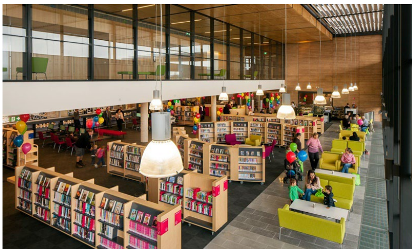
Фиг. 1. Библиотеката „Крейгибърн“ е първият носител на наградата „Обществена библиотека на годината“.

Наградата „Обществена библиотека на годината“ се присъжда от 2014 г. Седем библиотеки са нейни носители до 2022 г., като победители не са излъчени през 2017 и 2020 г. За първи път приза получава библиотеката „Крейгибърн“ в град Хюм, Австралия (вж. фиг. 1). Благодарение на сътрудничеството между архитекти, Градския съвет и местната общност тя е пример как една съвременна библиотека може да помогне за налагането на високи стандарти за проектиране на нова градска среда. Библиотеката се откроява като значима модерна конструкция с разпознаваема архитектурна концепция. Тя е важен център за бързо разрастващата се общност в град Хюм. В допълнение към библиотечните услуги сградата разполага с художествена галерия, кафене, детски кът, центрове за компютърно обучение и заседателни и многофункционални пространства, привличайки голям брой посетители. „Крейгибърн“ е добър пример как библиотеката може да създаде усещане за принадлежност у всички демографски групи. 3