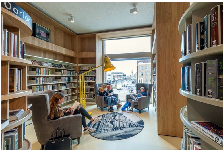
Фиг. 4. Сградата на библиотеката пази атмосферата и духа на старото училище.

Наричана „Новата Александрийска библиотека на Севера“ (Ооди 2018), „Ооди“ – централната библиотека на Хелзинки, Финландия, става носител на наградата „Обществена библиотека на годината“ през 2019 г. (вж. фиг. 5). „Ооди“ е некомерсиално градско обществено пространство, което е достъпно за всички и предоставя на своите потребители както знания и нови умения, така и възможност за потапяне в историята, работа и почивка. Библиотеката е проектирана съвместно с жителите на града, така че да отговаря най-добре на желанията и нуждите на потребителите. Идеи и съвети са събрани на градски събития и семинари, както и чрез уебсайтове и различни кампании. Колекцията на „Ооди“ включва книги на 20 езика и материали за деца, младежи и възрастни. Там всеки е добре дошъл да участва в разнообразни събития и семинари, да посещава лекции или да се вдъхнови от изкуството – седем дни в седмицата от сутрин до вечер, по време на празници, почивни и делнични дни. Всички събития са безплатни и отворени за обществеността. 8