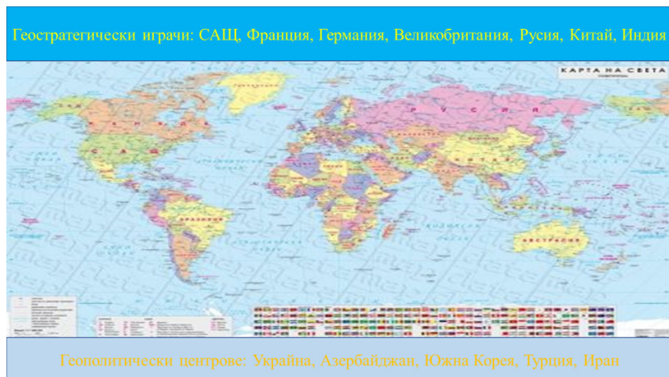
Фиг. 4. Геостратегически играчи и геополитически центрове на съвременното според Збигнев Бжежински (1998 г.)

Кои могат да се явят на квалификации за оставане или включване в голямата игра: