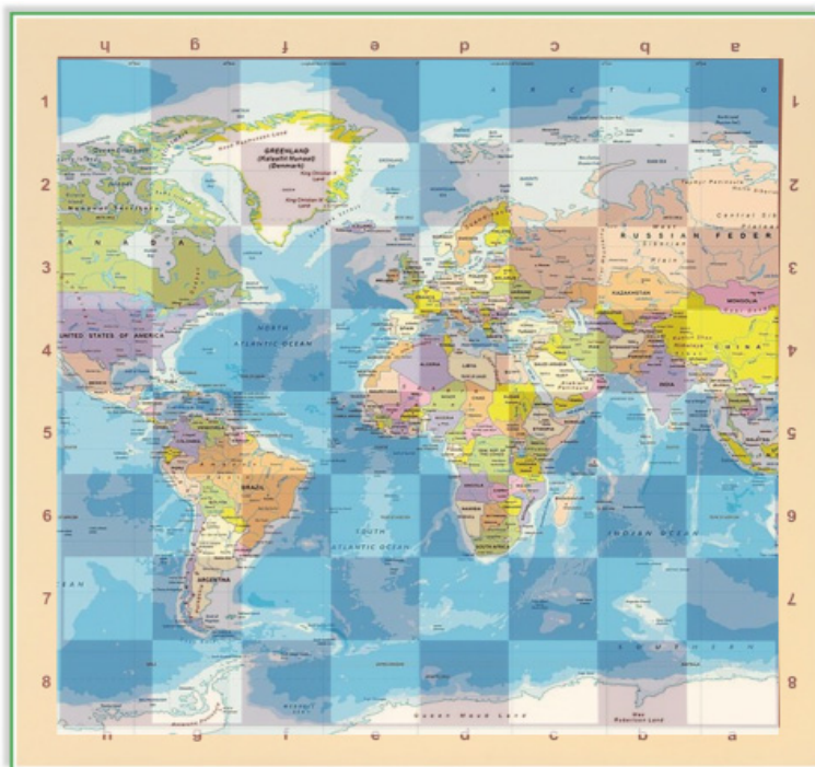
Фиг. 1. Голямата игра и голямата шахматна дъска

рия, която създава в Азия, а Русия се страхува от военното и търговското навлизане на Великобритания в Централна Азия. Историците смятат, че голямата игра приключва на 10 септември 1895 г., когато са подписани протоколите на Комисията за границите на Памир.