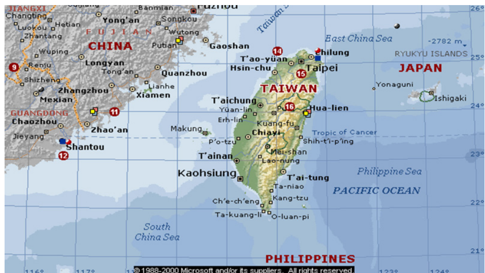
Фиг. 3. Географска карта на Китай и Тайван

Друго изпитание пред света ще възникне, ако Китайската народна република (КНР) реши точно сега да „приобщи“ Тайван [14] (Република Китай). В Тайван проблемът се определя от историческите дадености и вътрешната политика на територията – куриозното е, че голяма част от общественото мнение не признава опцията за независимост, въпреки реалностите на живота (вж. фиг. 3).