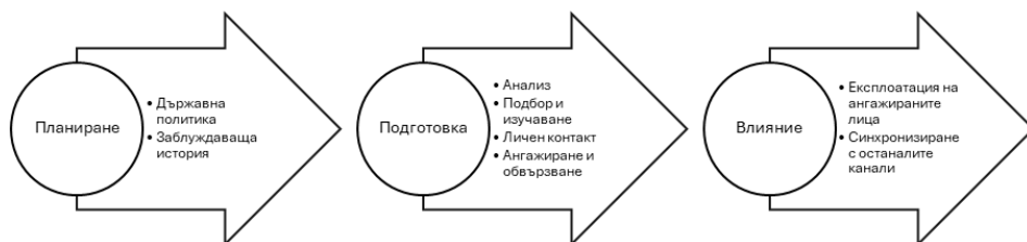
Фиг. 3. Модел на процес на влияние върху обществените нагласи

Влиянието върху обществените нагласи е процес, който може да се определи като съществена част от хибридната война. За създаване на описателно-обяснителен модел на въздействието е подходящо изследването на Бенет и Уолц за заблудата и контразаблудата. Според Бенет и Уолц процесът на заблуда може да се представи като информационен поток [2]. В него разузнавателните служби имат основна роля в активното изграждане и поддържане на позиции за влияние чрез привличане и експлоатация на лица, разпознаваеми и значими за обществото (вж. фиг. 3).